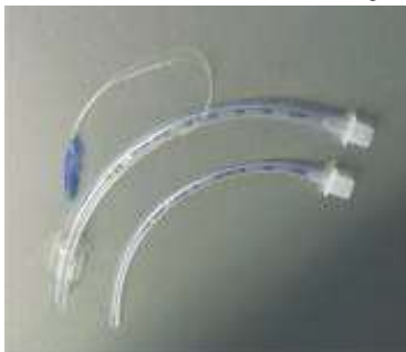
TUBO ENDOTRAQUEAL CON Y SIN BALÓN

OBSERVACIONES: Descartar luego de usar, No usar si el paquete esta abierto o dañado (producto desechable). Vida útil: 5 años.